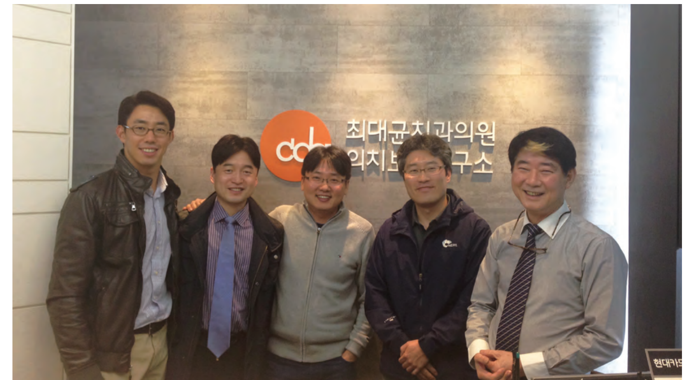
글·사진 치과교정학교실 박기호 편집 치과보철학교실 백정현

치전원 졸업 나이 평균 30이라 생각하고, 70까지 치과의사로서 활동한다고 생각하면, 무려 40년동안이나 치과의사로서 생활하게 됩니다. 그 중에 4년을 수련에 몸담는 것은, 결코 긴 시간, 아까운 시간이 아닙니다. 수련을 받으면 어떤 과를 선택하든지 더 많은 배움의 기회를 가질 수 있지요.